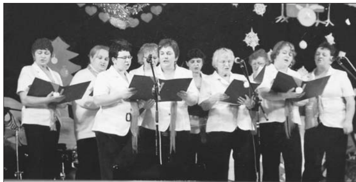
Zespół „Kwiat Lotosu” chętnie bierze udział w gminnych wydarzeniach

Panie z Puszczy dowodzą, że uparte i kreatywne kobiety wiele mogą. Mieszkanki sołectwa, działające w Kole Gospodyń Wiejskich i śpiewające w zespole śpiewaczym „Kwiat Lotosu” dbają o tradycję i jeszcze świetnie się przy tym bawią. A razem z nimi cała wieś.