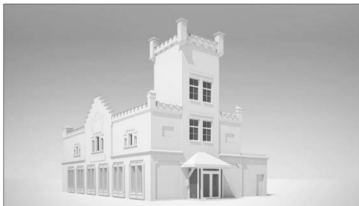
(na zdjęciu graficzna wizualizacja powstającego Centrum)