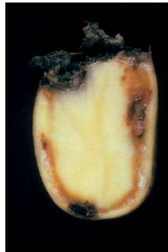
Fot. 1. Przekrój przez porażoną bulwę z zamierającymi wiązkami przewodzącymi

bakteria wywołująca chorobę ziemniaków zwaną śluzakiem (brązową zgnilizną lub brunatną zgnilizną ziemniaka)