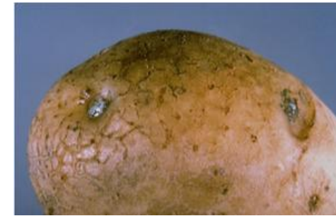
Fot 3 i 4. Wyciek śluzu z oczek bulwy i przekrój przez porażoną bulwę z zamierającymi wiązkami przewodzącymi